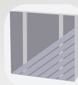
Pose diagonale simple lambourdaage