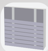
Pose horizontale simple lambourrage