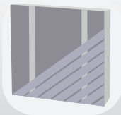
Pose diagonale simple lambourde