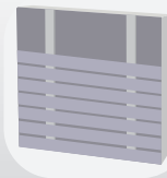
Pose horizontale simple lambourde

6. Utilisez uniquement des pointes inox pour la fixation de votre bardage. Veillez à bien protéger les points de fixation et à traiter les coupes. Pour les lames dont la largeur est supérieure à 125 mm, elles doivent être fixées avec deux pointes dans la largeur.