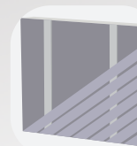
Pose diagonale simple lambourrage