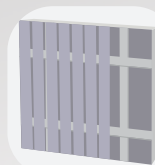
Pose verticale double lambourrage