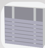
Pose horizontale simple lambourrage