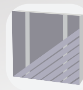
Pose diagonale simple lambourrage