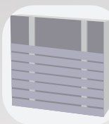
Pose horizontale simple lambourrage