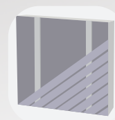
Pose diagonale simple lambourrage